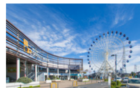
从三井奥特莱斯仙台港 出发步行约10分钟