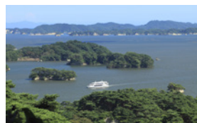
從松島前往約30分鐘